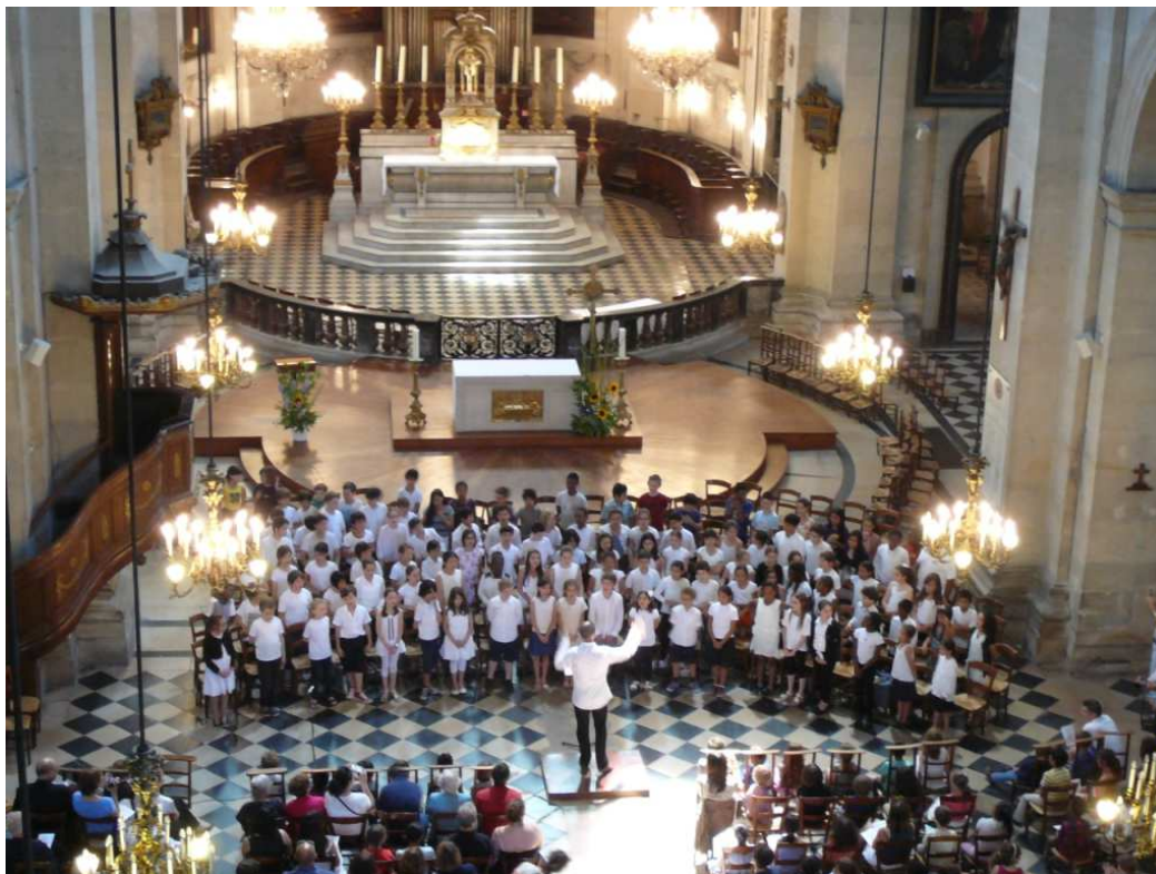
Concert du 29 juin 2015 église St-Paul St-Louis