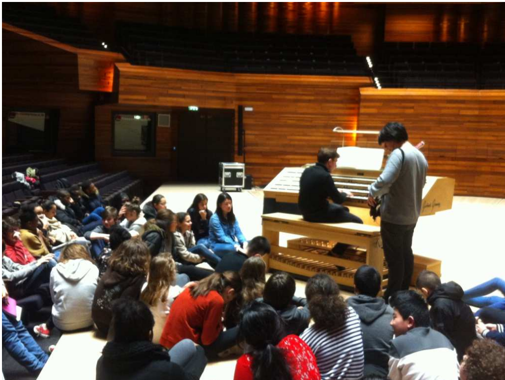
Les collégiens autour de la console du grand orgue à Radio France février 2017

J'ai bien aimé pouvoir voir jouer quelqu'un en vrai et pas derrière un écran.