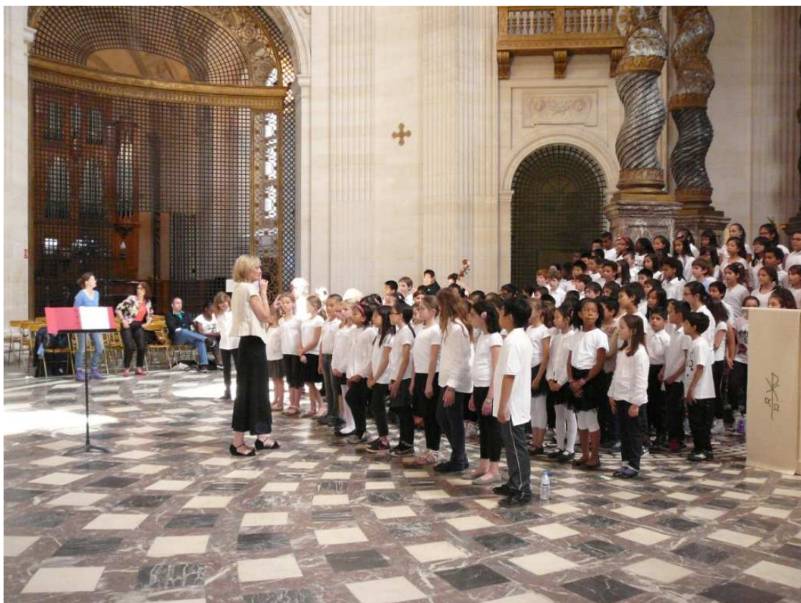
Concert du 4 juin 2015 au Val-de-Grâce

Hymne européen Poème de Schiller, musique de Beethoven Chœur et orgue