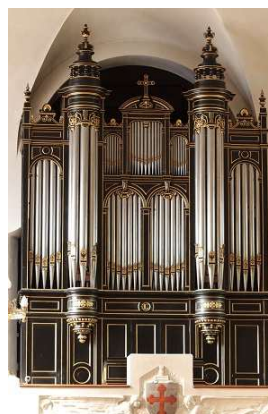
Orgue de St-Maurice de Bécon