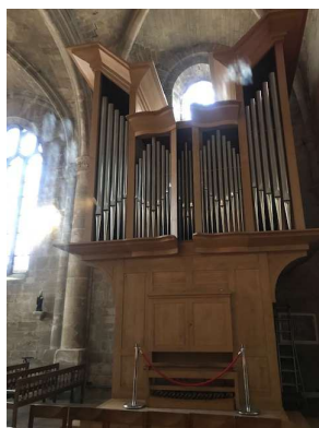
Orgue de l'église d'Auvers